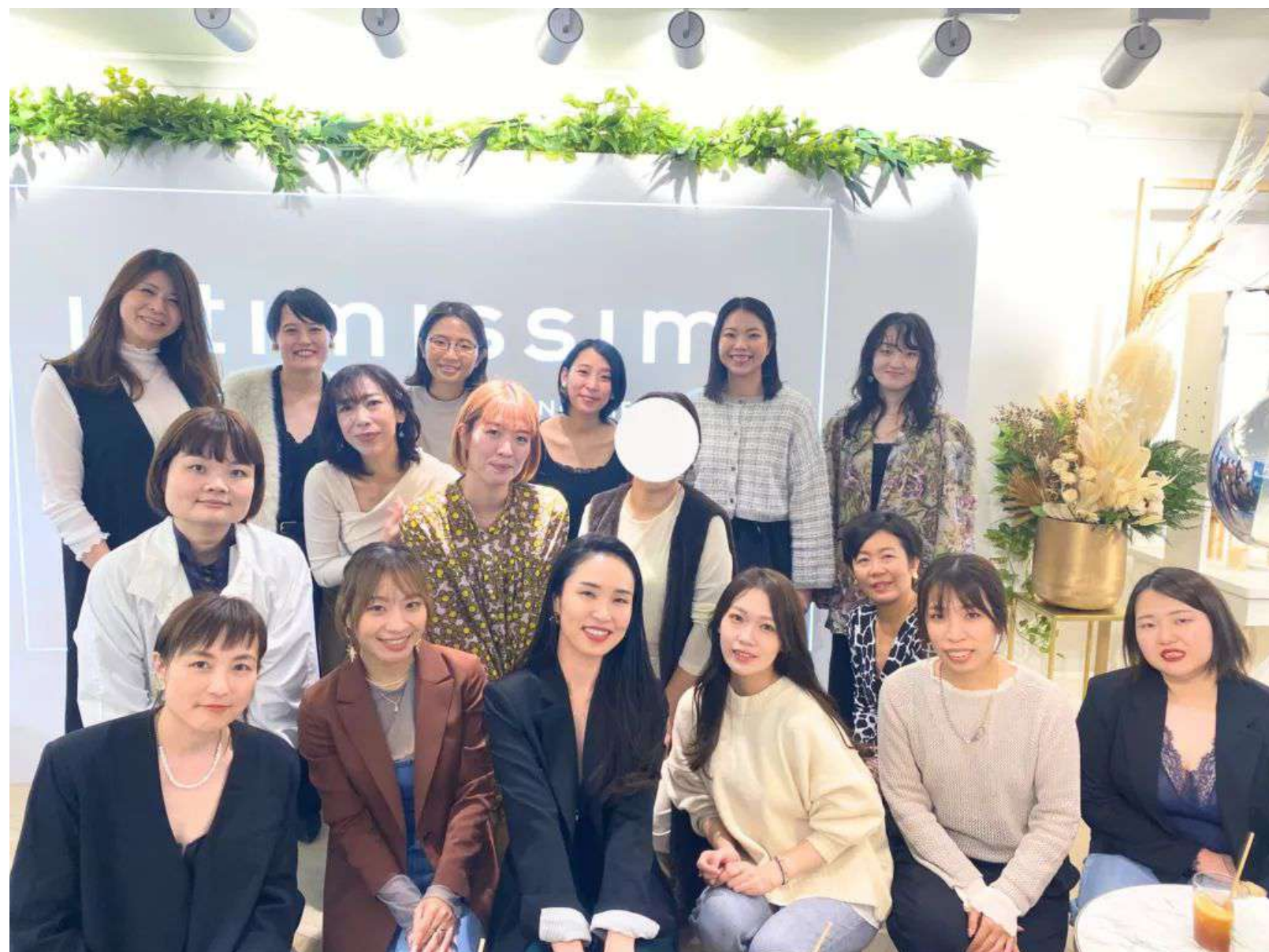
オフライン(Intimissimiコラボイベント)